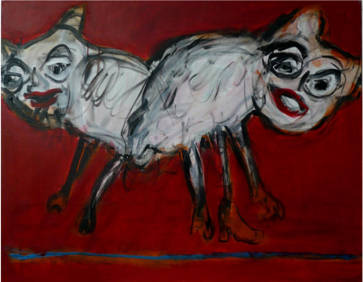
« Bêtes sur fond rouge » 2010 Acrylique sur toile 80 x 100 cm

Une œuvre colorée, grinçante, libre et contrastée, d'un expressionnisme fougueux explorant le corps féminin, la sociabilité et l'animal à travers un bestiaire humanisé, tendre et teinté d'humour.