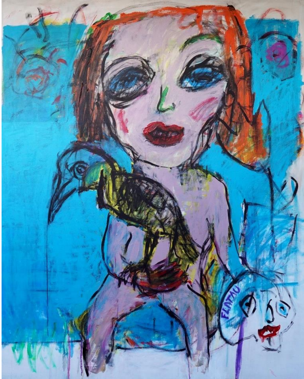
« Vanity blues » Acrylique sur toile 162 x 130 cm