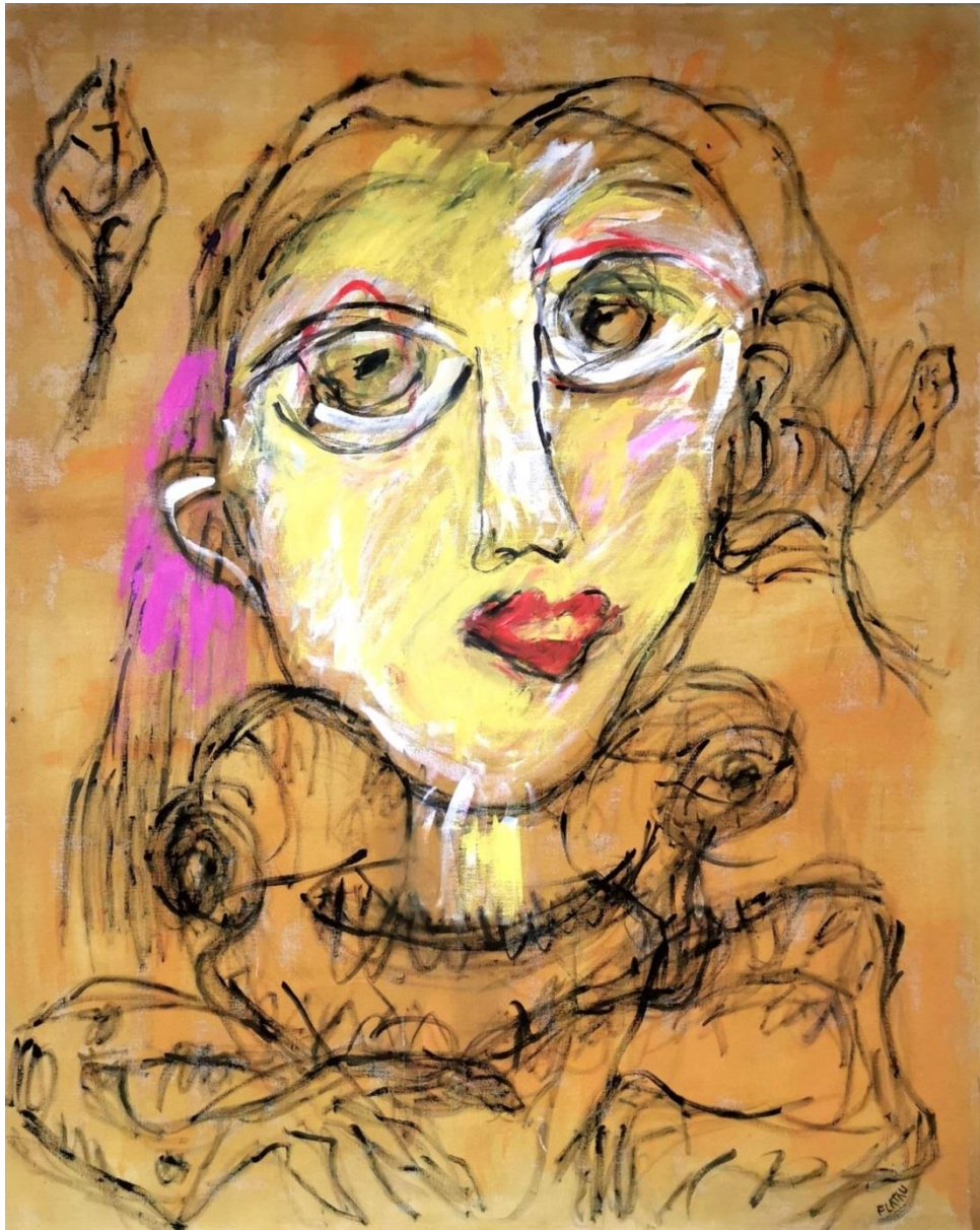
« Fabulation » 2024 Technique mixte sur toile 162 x 130 cm