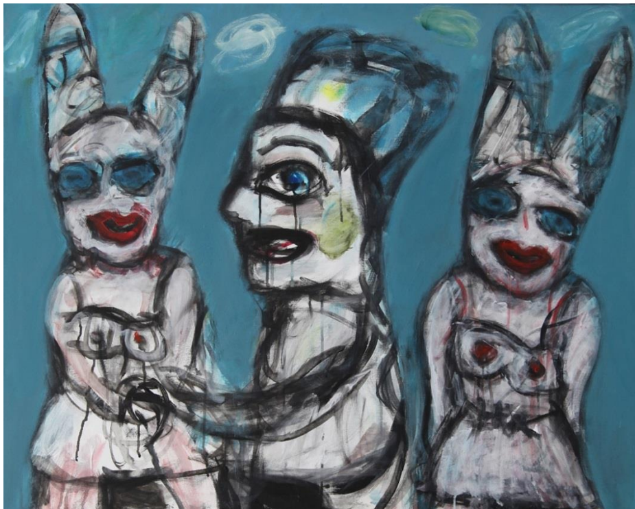
« Jalousie » 2012 Acrylique sur toile 80 x 100 cm

1995 - Galerie de l'Ancienne Douane, Saint-Prex (Suisse) 1997 - La Maison Internationale des Poètes et des Ecrivains, Saint Malo 1999 - Galerie Plexus de Richard Aeschlimann à Chexbres (Suisse) 1999 - Centre Culturel Rachi, Paris 2000 - Galerie Veronique Smagghe, Paris 2002 - CastanGalerie Art Actuel, Perpignan 2002 - Galerie Idées d'Artistes, Paris 2003 - Galerie Geneviève Favre, Avignon 2004 - Galerie Idées d'Artistes, Paris 2007 - Espace Beaurepaire, Paris 2008 - Galerie Claire Corcia, Paris 2009 - Espace Beaurepaire, Paris 2010 - Galerie Europa, Paris 2011 - Galerie Le Cabinet d'Amateur, Paris 2011 - Castan Galerie Art Actuel, Perpignan 2012 - Galerie Roi Doré, Paris 2017 - Galerie Le Cabinet d'Amateur, Paris 2024 - Galerie Claire Corcia, Paris