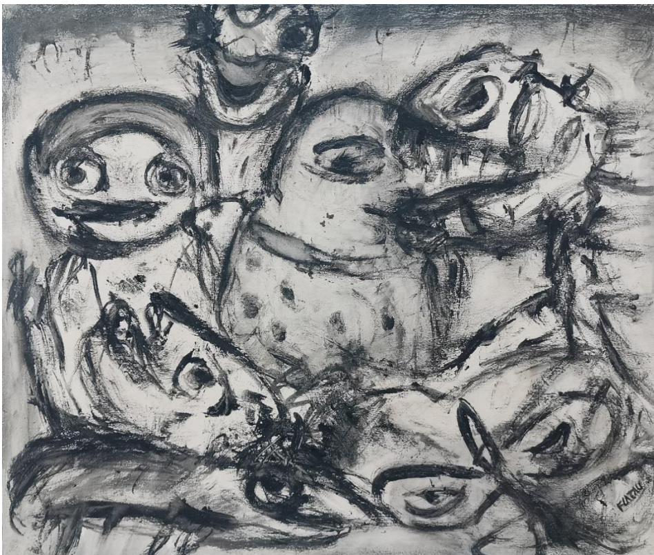
« Bizarre » 2016 Technique mixte sur toile 46 x 55 cm

2017 - « Chercheur d'art, 60 artistes contemporains » par Denis-Louis Colaux, pages 68-69, éd. Jacques Flament Editions