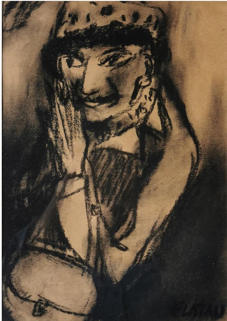
« Les gens d'ici » Fusain sur papier 40 x 30 cm