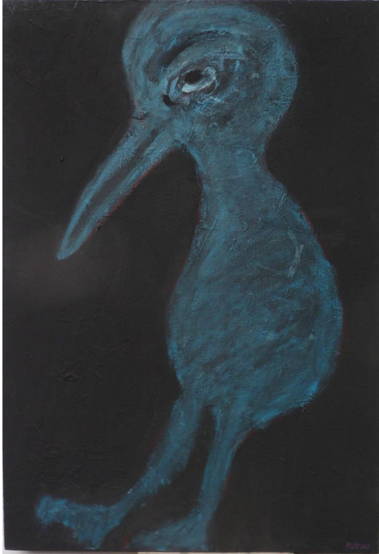
« Oiseau bleu » 2009 Acrylique sur toile 116 x 81 cm