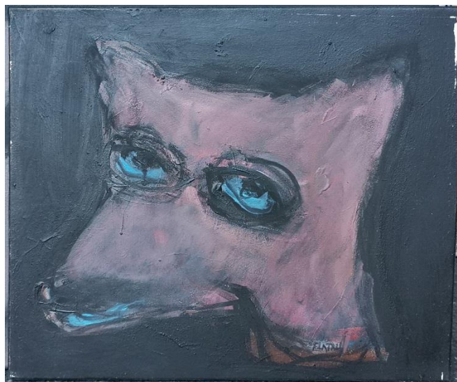
« Renard » Acrylique sur toile 38 x 46 cm